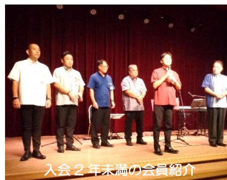
入会2年未満の会員紹介